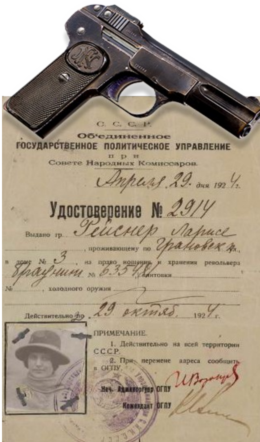
Le nouveau browning № 635.481. de L.Reisner, du GPU